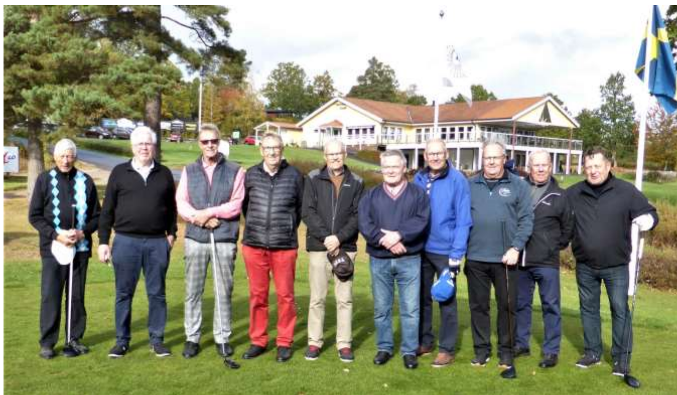
Bilden ovan, de 10 spelare som gick vidare, efter matchspelet år 2019