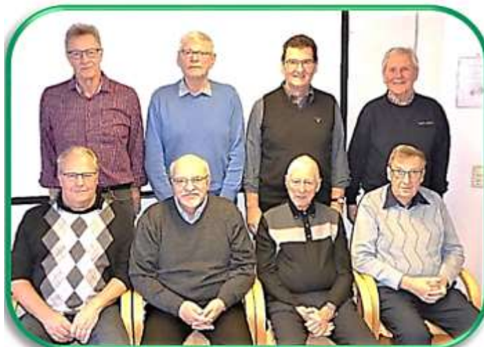
Veterankommittén januari 2020